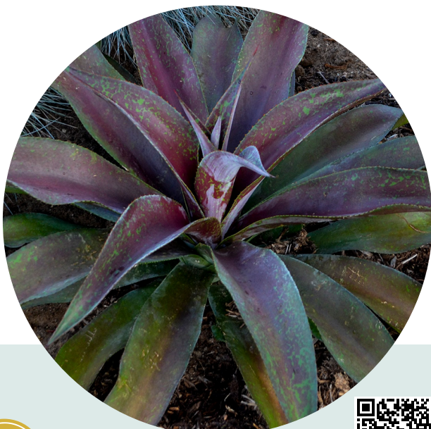
MISSION TO MARS