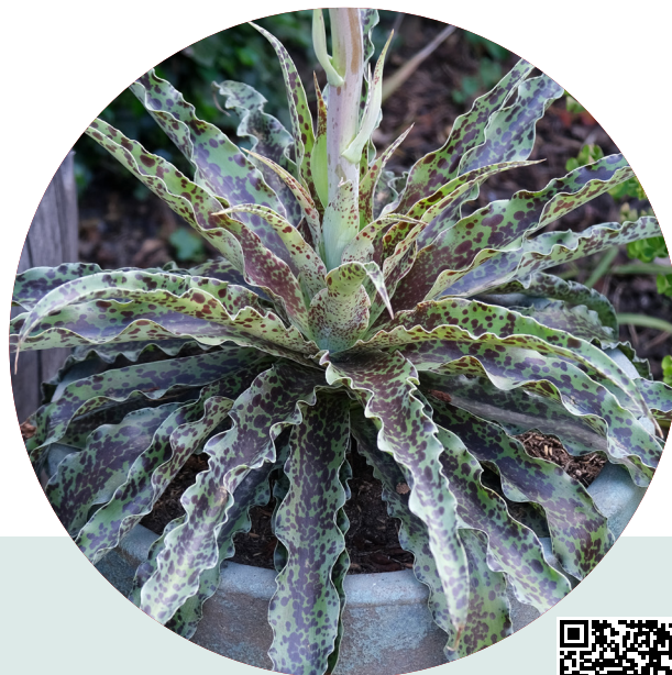
MINT CHOCOLATE CHIP