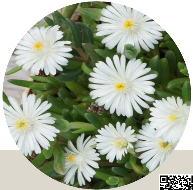
JOD MOON STONE